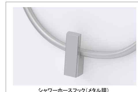
シャワーホースフック(メタル調)