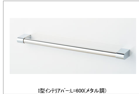
I型インテリアバー:L=600(メタル調)