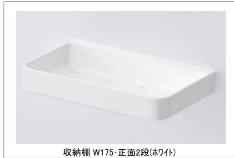
収納棚 W175・正面2段(ホワイト)