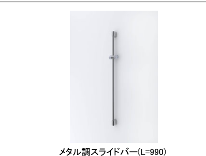
メタル調スライドバー(L=990)