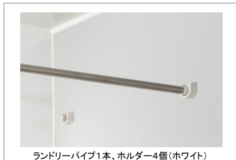
ランドリーパイプ1本、ホルダー4個(ホワイト)