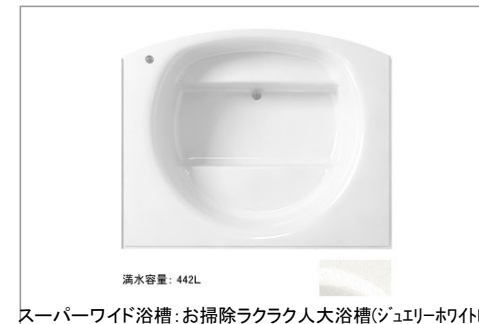
スーパーワイド浴槽:お掃除ラクラク大人浴槽(ジュエリーホワイトN)