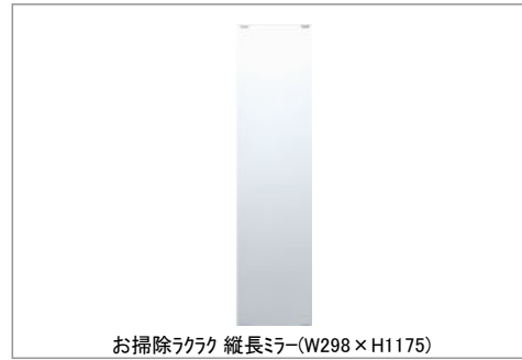
お掃除ラクラク 縦長ミラー(W298×H1175)