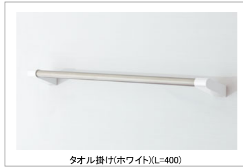
タオル掛け(ホワイト)(L=400)