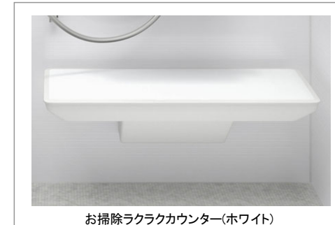
お掃除ラクラクカウンター(ホワイト)