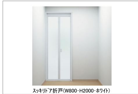
スキッドア折戸(W800・H2000・ホワイト)