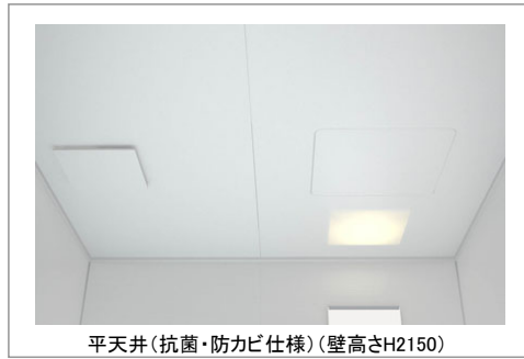
平天井(抗菌・防カビ仕様)(壁高さH2150)